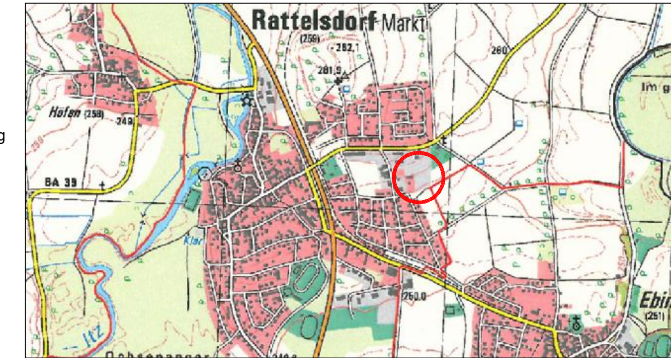
Übersichtskarte ohne Maßstab